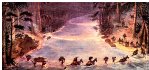
Fig. 1 - Gravura de Jean-Baptiste Debret

As gravuras e desenhos são documentos que nos informam acerca de detalhes sobre a indumentária, os usos e costumes que muitas vezes não são relatados nos textos escritos. Atualmente estamos trabalhando com os desenhos de Jean-Baptiste Debret, na “Viagem Pitoresca e Histórica ao Brasil” (Debret, 1989).